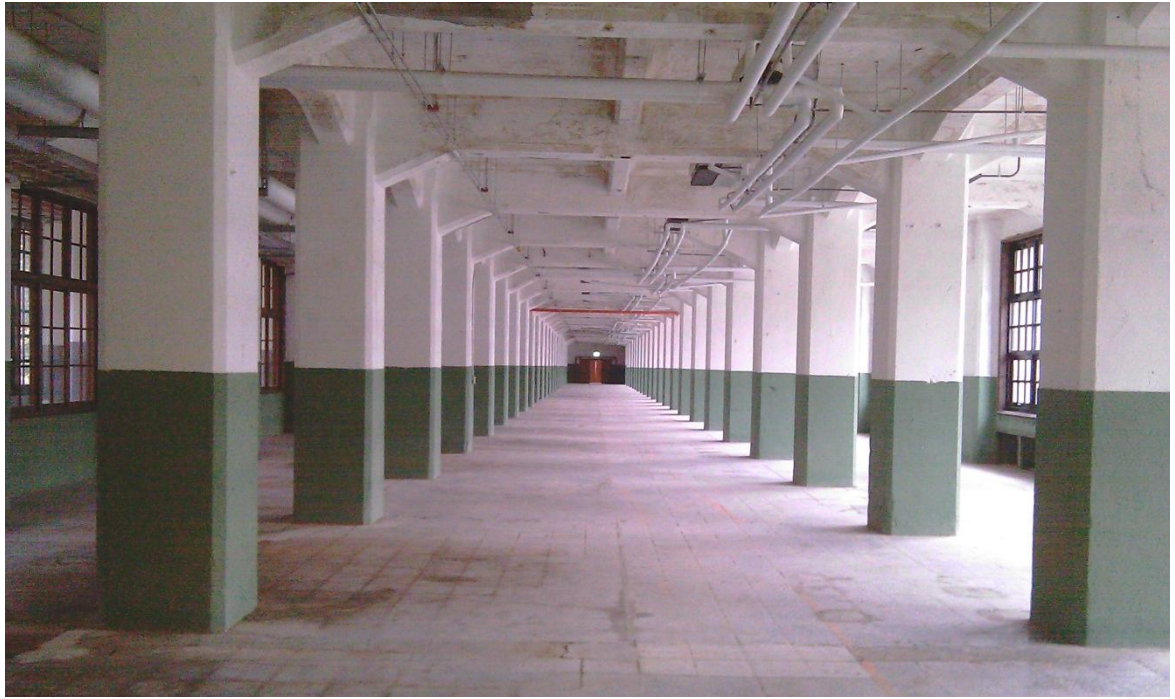
▲設計玩家館場地實景