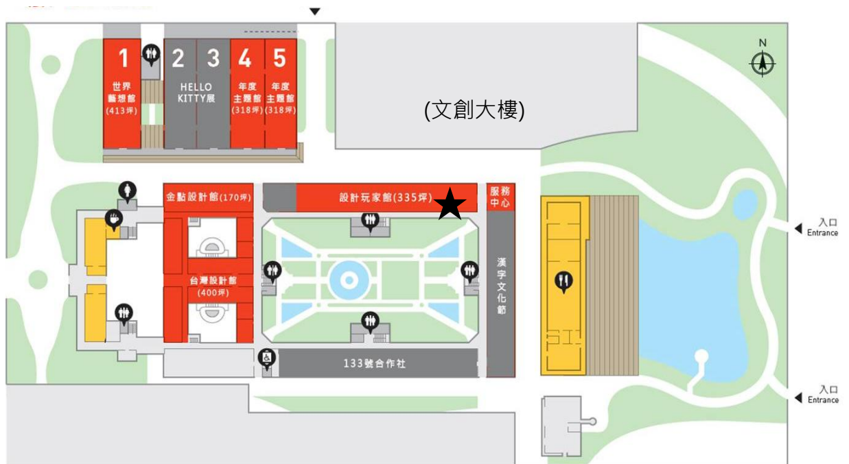
▲松山文創園區配置圖

本館展場總面積(包含走道、倉儲等公共空間)約為 360 坪，為配合場地現狀(多柱)， 每 1 展出攤位尺寸規劃為 2.8m*4.2m ，共計約有 30 個攤位。 預計透過審查會議徵選出 10~15 個參展單位，由參展單位提出申請，惟以 4 個攤位為申請上限。