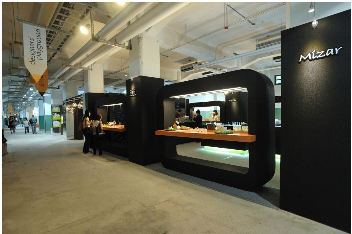
▲2011 臺北世界設計大展「設計玩家館」展出實況